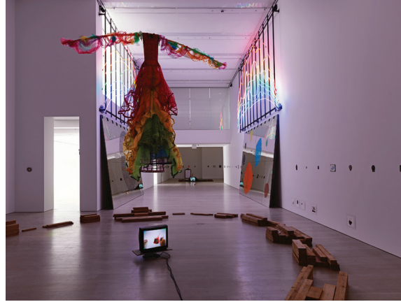
Sarkis SONSUZ Küratör: Emre Baykal Sergiden görünüm Arter, 2023