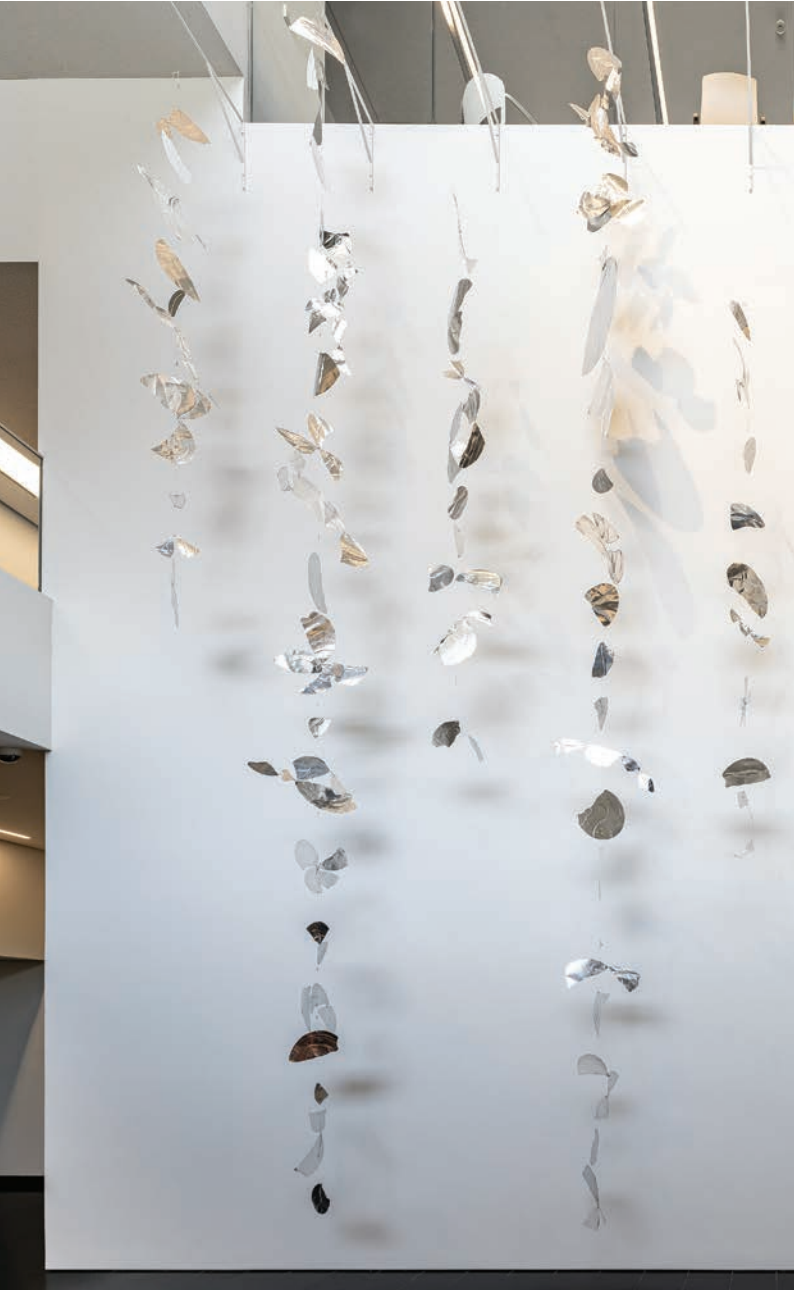
9 Dizi ve Yansımalar, 1986