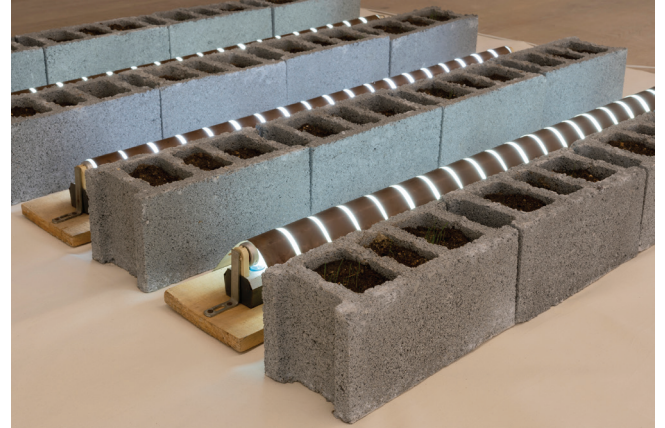
Cengiz Çekil Düzenleme No. 5, 1987 Bez, briket, toprak, çim tohumu, floresan ampul, bakır levha, ahşap, elektrik ekipmanı ve akımı 20 x 200 x 200 cm Düzenleme No. 5, sanatçının arşivinde yer alan belgelerden yola çıkılarak bu sergi için yeniden üretilmiştir.