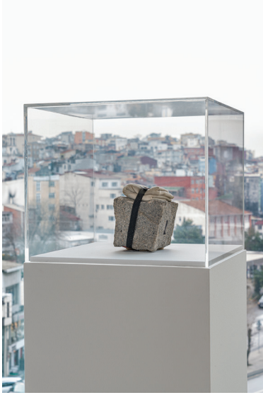
Cengiz Çekil Uyandırma, İletişim Taşı, 1987 Taş, bez, bağlama çemberi, boya 10,5 x 9 x 9 cm Keyman Koleksiyonu, İsviçre