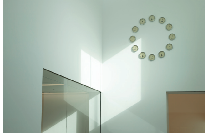
Cengiz Çekil: Bugün de Yaşıyorum Küratör: Eda Berkmen Sergiden görünüm Arter, 2023