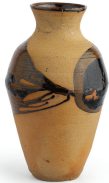
Candeğer Furtun Vazo 1963

Seramik 14 x 21,5 x 13,5 cm