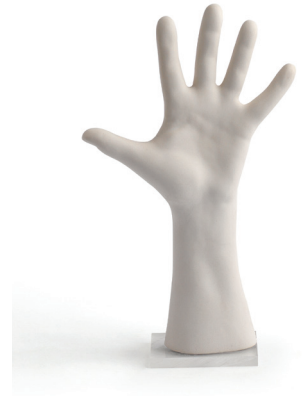
Candeğer Furtun İmdat (detay) 2010 Seramik 27 x 17 x 6 cm