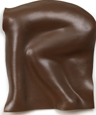
Candeğer Furtun Depar (detay) 1988

Seramik 65 x 46 x 17,5 cm