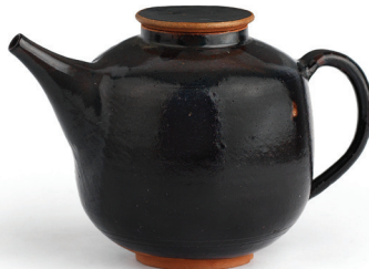
Candeğer Furtun Çaydanlık 1963

Seramik 25,5 x 23 x 23 cm