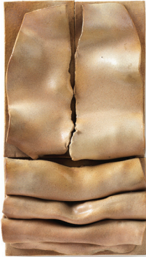
Candeğer Furtun Ferman 1973 Seramik 58 x 33 x 10 cm