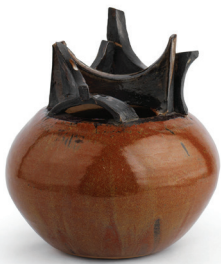
Candeğer Furtun İsimsiz 1963

Ceramic 51 x 29,5 x 24,5 cm