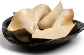
Candeğer Furtun İsimsiz 1973 Seramik 16 x 36,5 x 34 cm