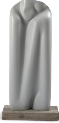
Candeğer Furtun Suskun (detay) 1987 Fiberglas 3 adet; her biri 123 x 46 x 8 cm

CANDEĞER FURTUN KÜRATÖR | CURATOR: SELEN ANSEN