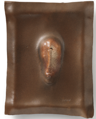
Candeğer Furtun Portre 1980 Seramik 53 x 41 x 5 cm