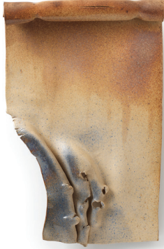
Candeğer Furtun Korku 1980 Seramik 53 x 35 x 6 cm