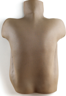
Candeğer Furtun Sirt 1988

Seramik 65 x 46 x 17,5 cm