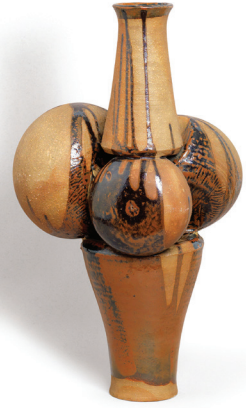
Candeğer Furtun Bereket Tanrıçası 1963

Seramik 3 adet; her biri 61,5 x 52 x 9 cm