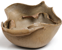
Candeğer Furtun Çanak 1973 Seramik 18 x 28 x 30 cm