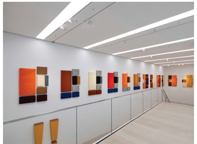
Franz Erhard Walther: Heykel Olma Teşebbüsü Sergiden görünüm Küratör: Selen Ansen Arter, 2025